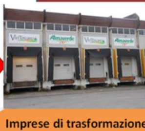
Imprese di trasformazione e commercializzazione VIVITOSCANO srl CS ETRURIA srl