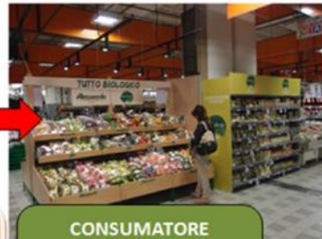
CONSUMATORE FINALE GDO HO.RE.CA