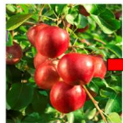
Aziende agricole Produzione primaria